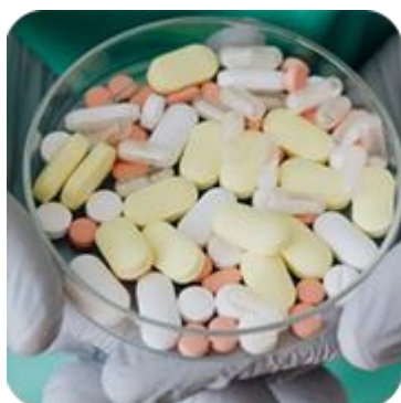
DIA EUROPEU DO ANTIBIÓTICO