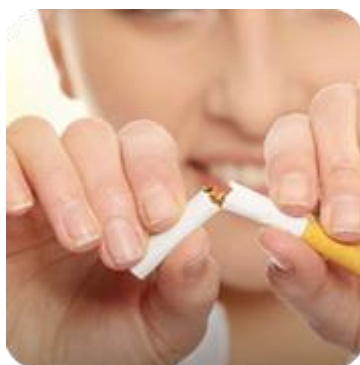
DIA NACIONAL DO NÃO FUMADOR