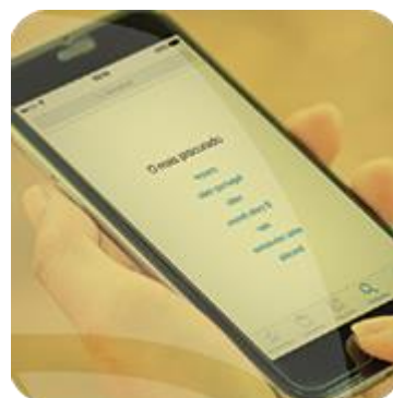
TRANSFORMAÇÃO DIGITAL NA SAÚDE